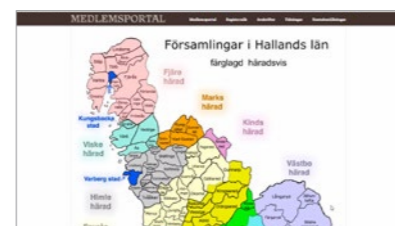
Olika vägar in i materialet på Hallands Släktforskarföreningens medlemsportal, här antingen via lista eller via klickbar karta.

ordagrant från originalhandlingarna. Utöver den finns ytterligare fyra databaser som täcker halländska emigranter, båtsmän, bouppteckningar och antavlor.