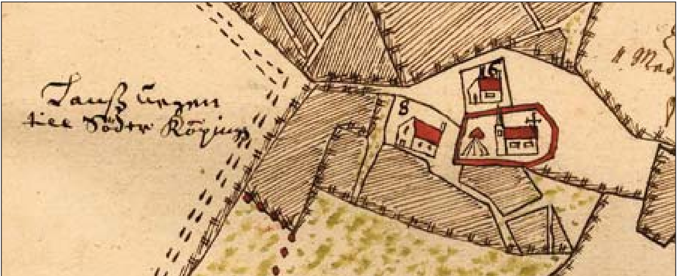
Projektet Geometriska jordeböcker lagt ut 12000 storskaliga bykartor från 1600-talet på RAs hemsida